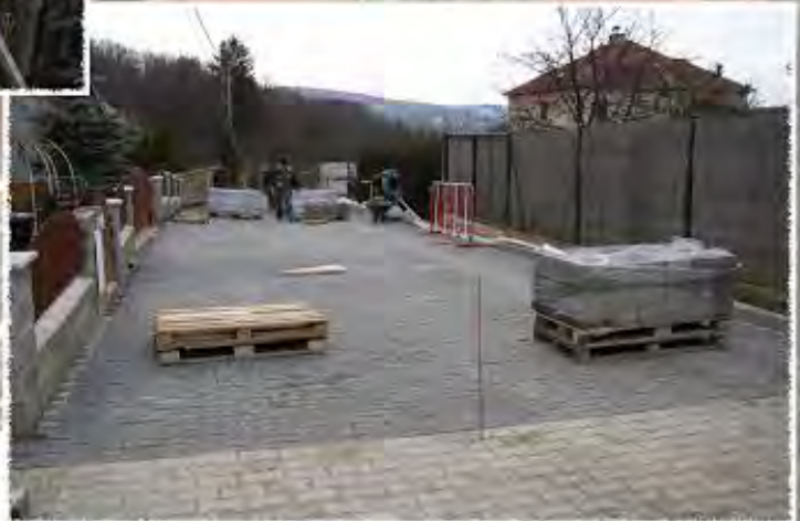
2009 - Kníničky - Komunikace