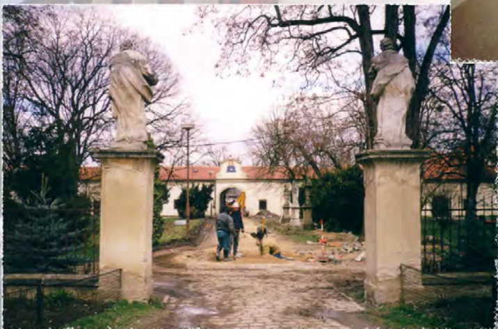
2001 - Benediktinský klášter Rajhrad - Kanalizace