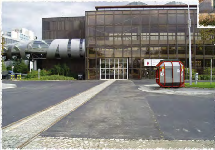
2006 - Veletrhy Brno Plochy u pavilonu B a E