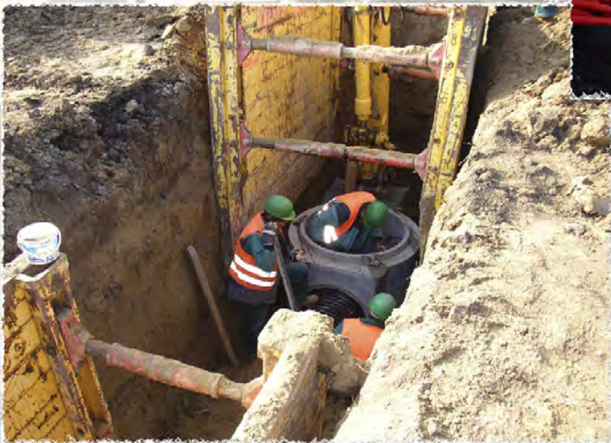
2008 - ČD Brno nádraží Kanalizace