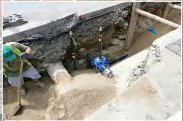
2011 - Zastávka - Vodovod