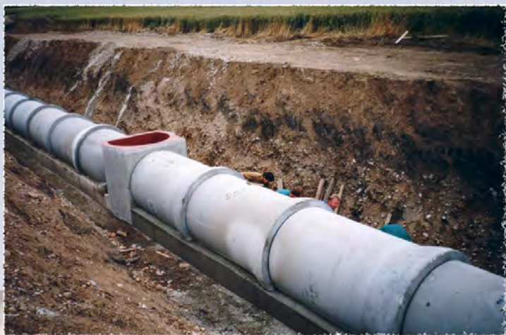
1997 - Olympia - Kanalizace