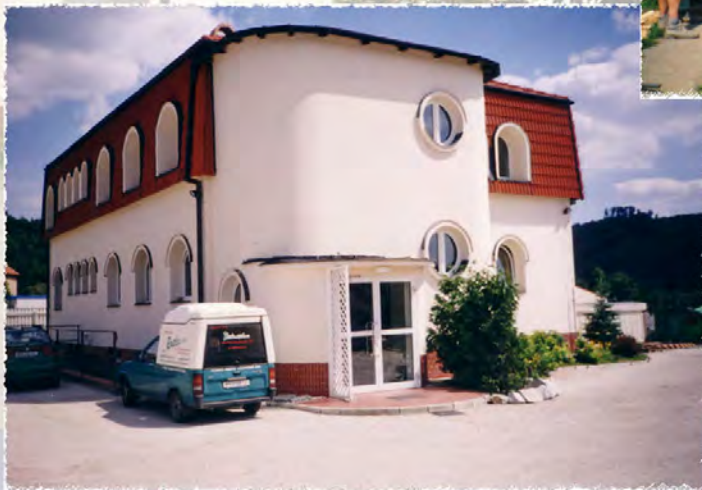
1996 - Vlastní sídlo společnosti