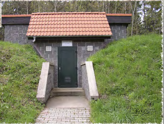
2000 - Zastávka - Vodojem