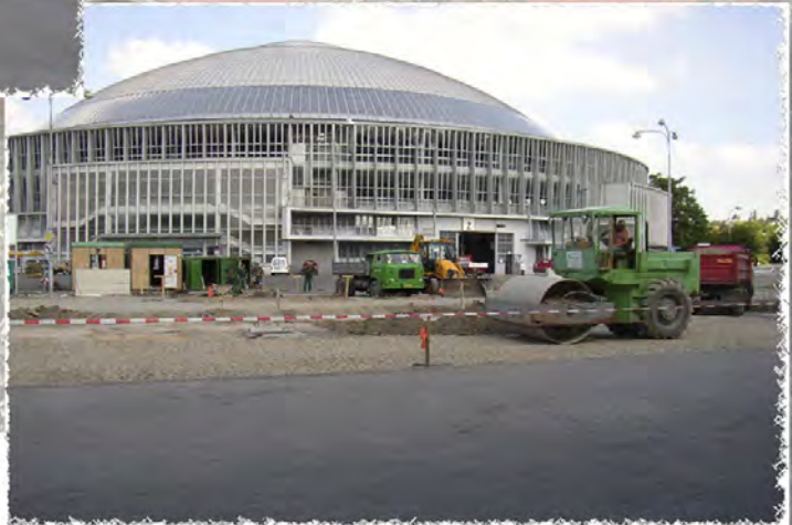
2005 - BVV plocha u pavilonu Z