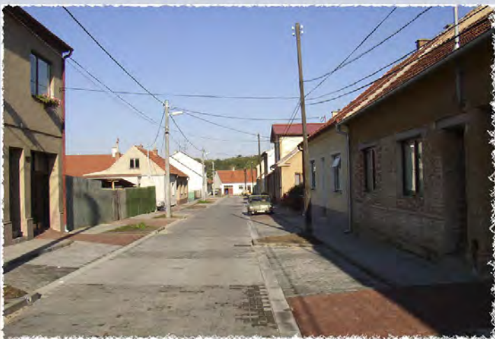
2003 - Omice ul. Dolny Komunikace vč. i.s.