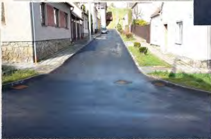
2014 - Rosice ul. Pod strání komunikace