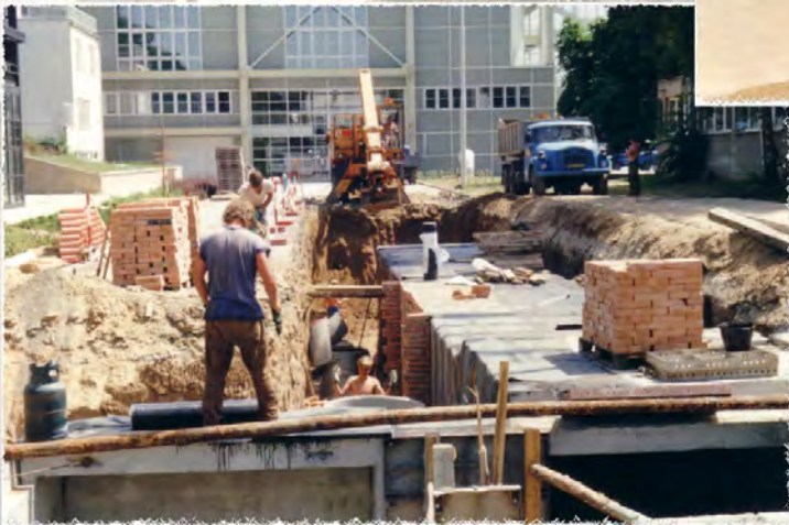
1992 - BVV - Kolektor