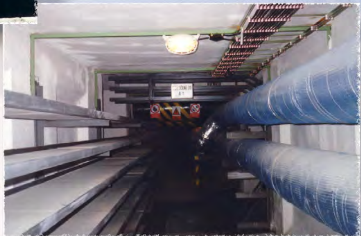
1992 - BVV - Vystrojení kolektoru