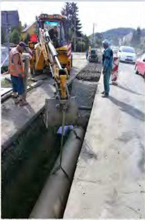
2011 - Zastávka - Kanalizace