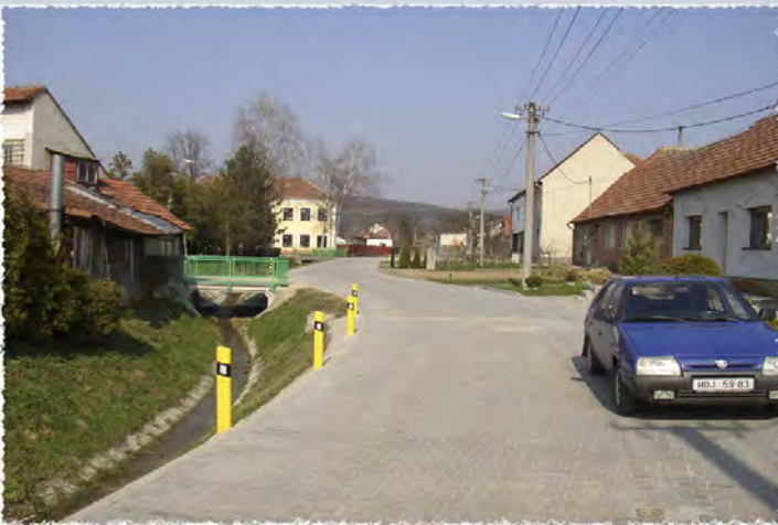
2006 - Dambořice - Komunikace