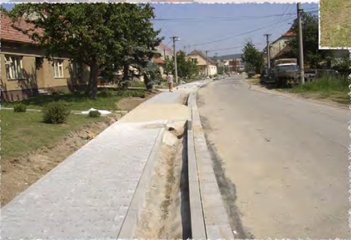
2003 - Dambořice - Chodník