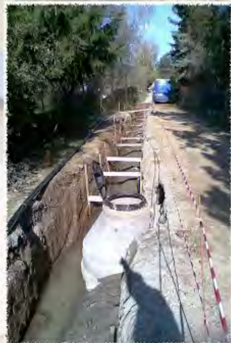
2010 - Tetčice - Kanalizace, vodovod