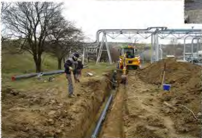
2009 - Klobouky - Čepro - Vodovod