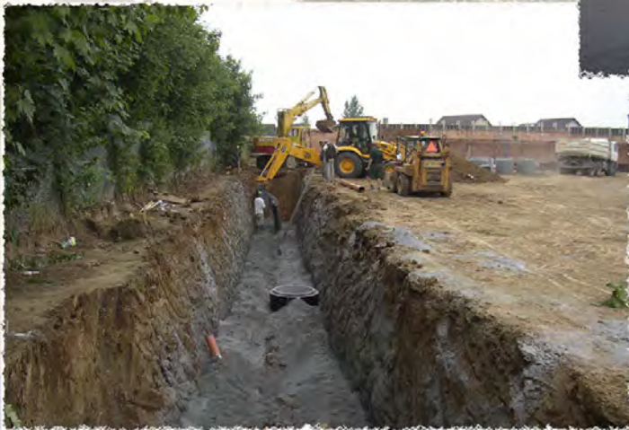
2005 - Rosice LIDL Kompletní i.s