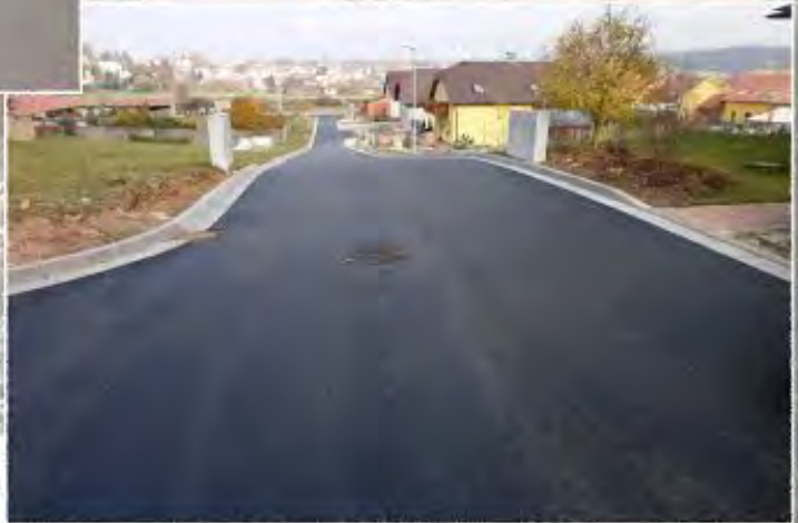
2013 - Rosice ul. Na Štěpnici komunikace