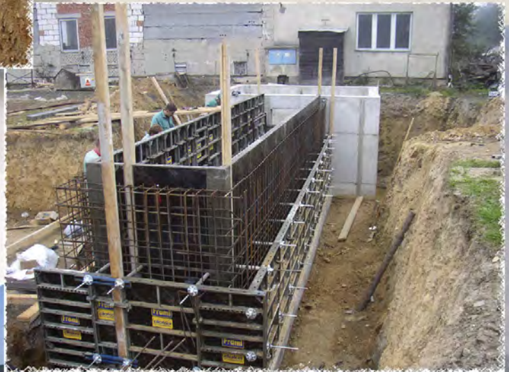
2007 - Krásensko Monolitické ŽB konstrukce pod sila