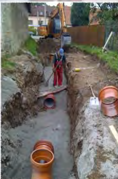
2012 - Lysice - Kanalizace