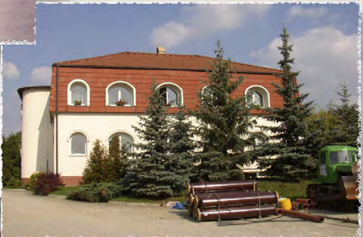
1996 - Vlastní sídlo společnosti