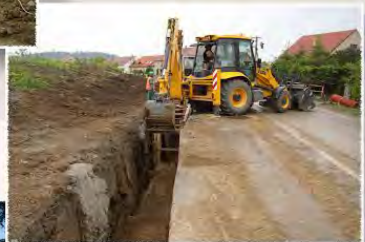
2009 - Bořitov - Dešťová kanalizace