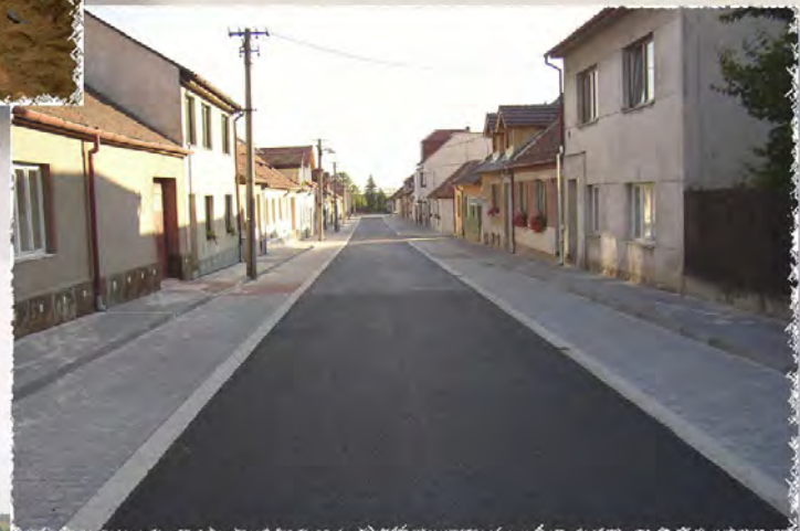
2004 - Rosice ul. Dělnická Komunikace, kanalizace