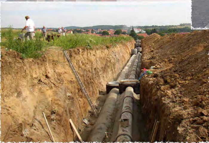
2004 - Žebětín Za kostelem Kompletní i.s