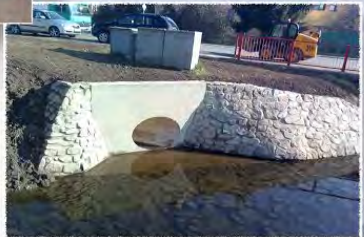
2012 - Zastávka - Výustní objekt