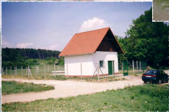
1999 - Příbram Vodovod, úpravna vod, čerpací studna