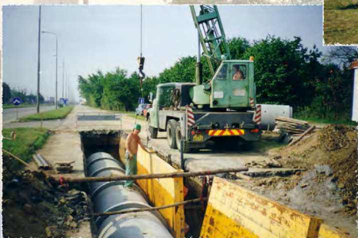
1999 - Carrefour - Kanalizace