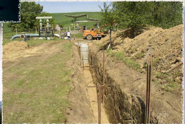
2003 - Čepro Klobouky Kanalizace