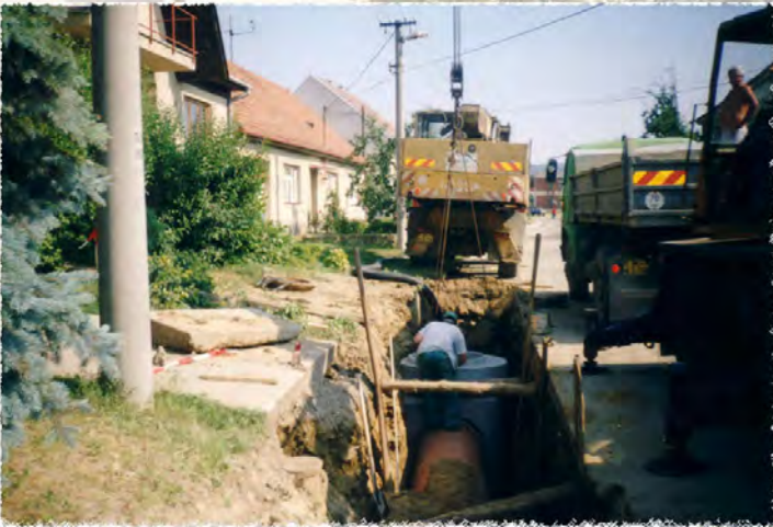
2003 - Dambořice - Kanalizace