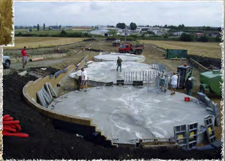
2008 - Blučina Monolitické ŽB konstrukce pod sila