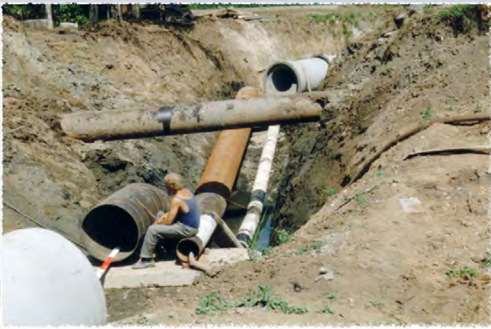
1991 - Rosice Kanalizační sběrač