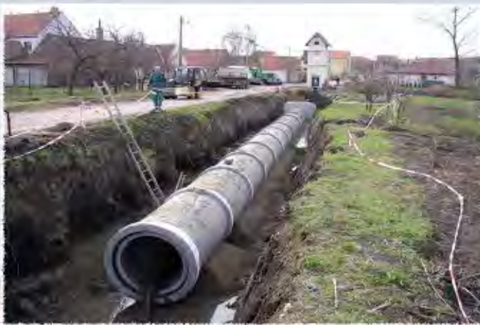
2010 - Starovičky - Kanalizace