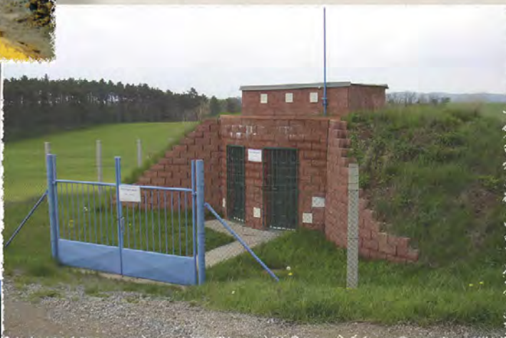
1999 - Řeznovice Vodojem, vodovod