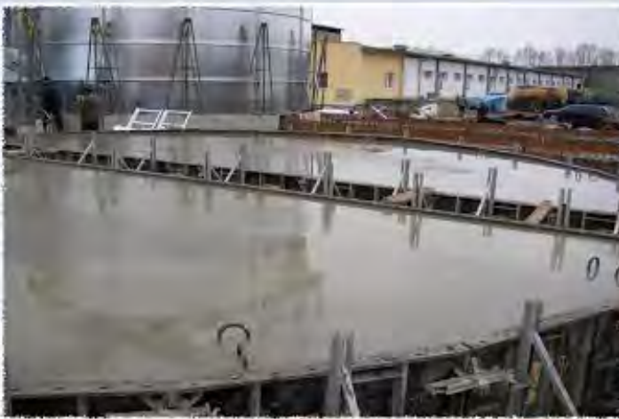
2009 - Kašenec Monolitická ŽB konstrukce pod sila