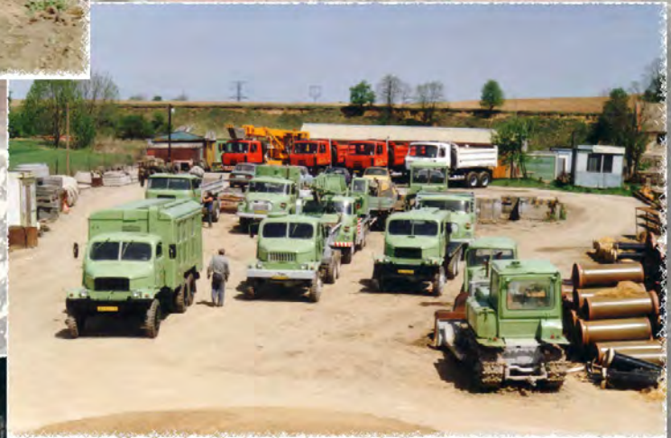
1992 - Vozový park společnosti