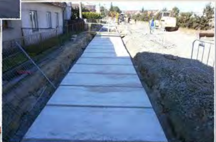
2014 - Tetčice - Zaklenutí potoka