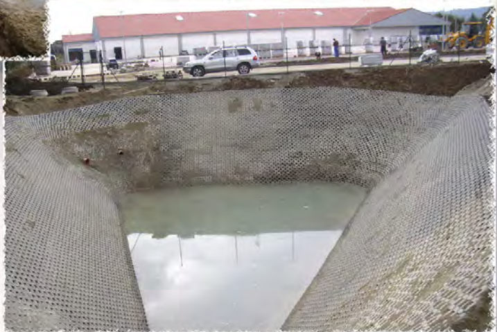
2005 - Rosice LIDL Vsakovací nádrž