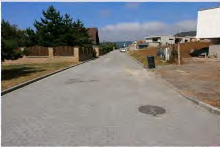
2013 - Rosice ul. Borová - Komunikace