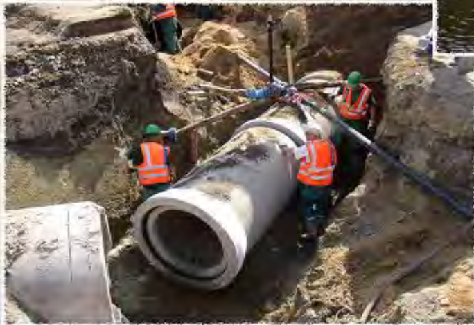
2010 - Starovičky - Přeložky vodovodů