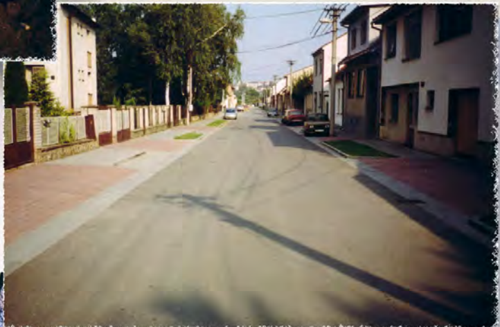
2000 - Tetčice ul. Tyršova Komunikace včetně i.s.