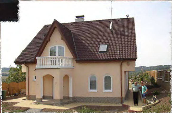
2003 - Rosice - Výstavba RD