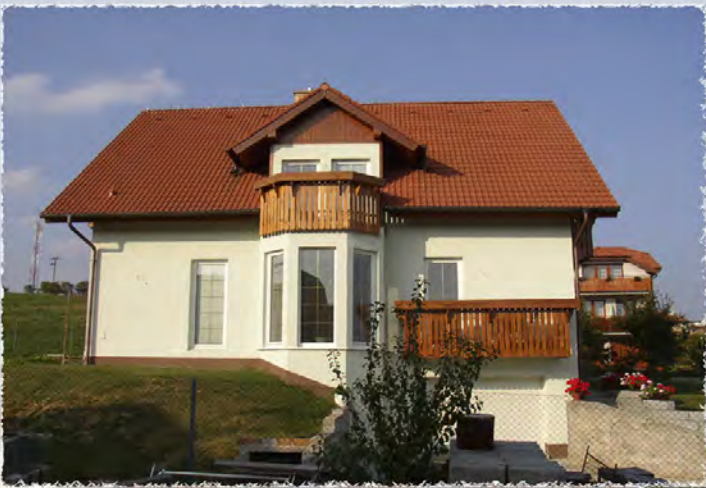
1999 - Žebětín - Výstavba RD