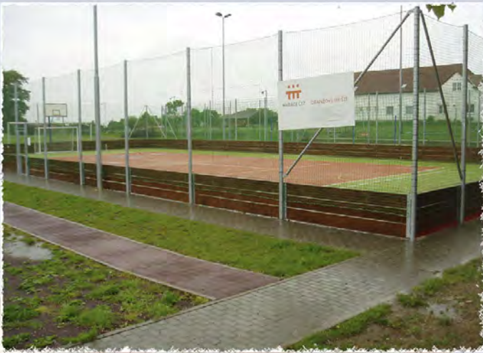
2007 - Jevišovice Víceúčelové hřiště