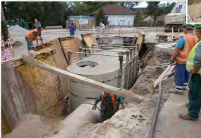
2011 - Zastávka Odlehčovací komora