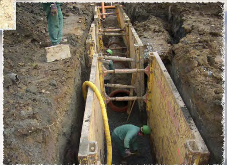
2008 - Náměšť nad Oslavou - Kanalizace