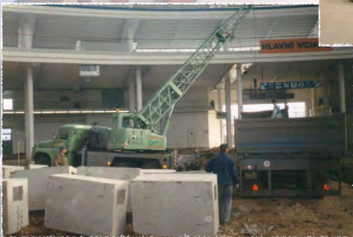
1997 - BVV - Podlaha pavilonu Z