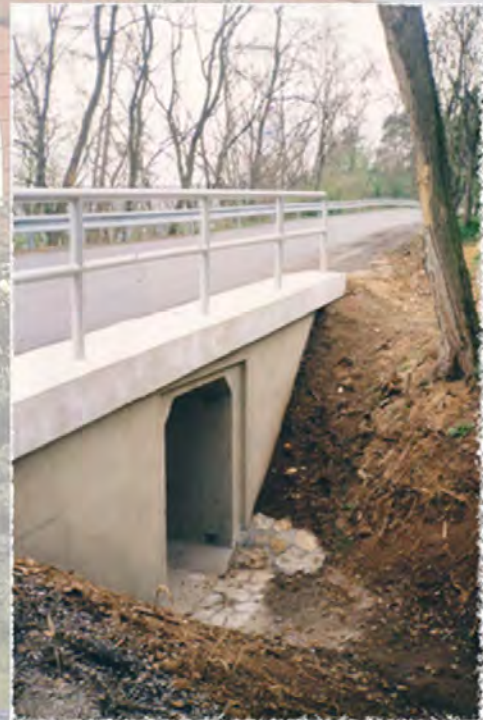
2002 - Omice - Propustek