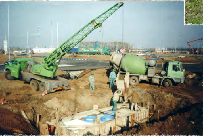
2000 - Shopping park - ORL