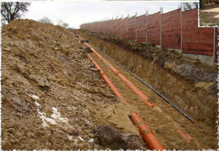
2004 - Moravany Pod Novosady Kompletní i.s