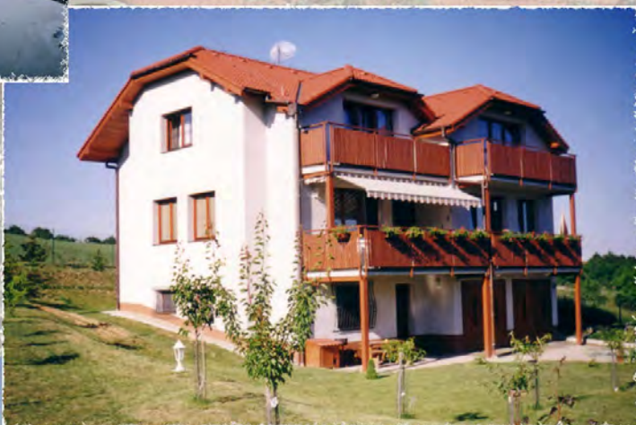
1998 - Brno - Výstavba RD