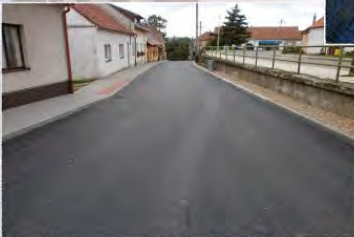
2014 - Zbýšov ul. Pod rybníkem - komunikace