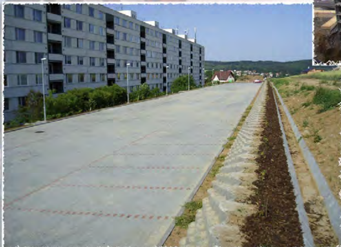
2007 - Rosice - Parkoviště nad ul. Kaštanová