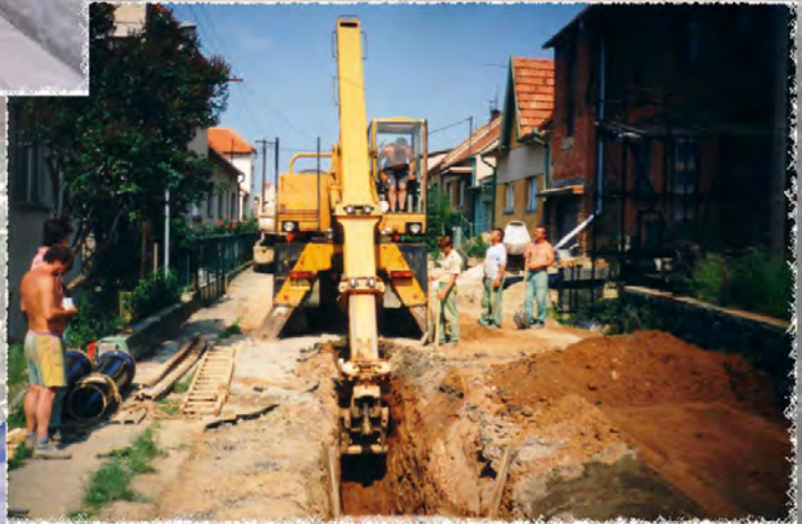
1995 - Ořešín - Kanalizace