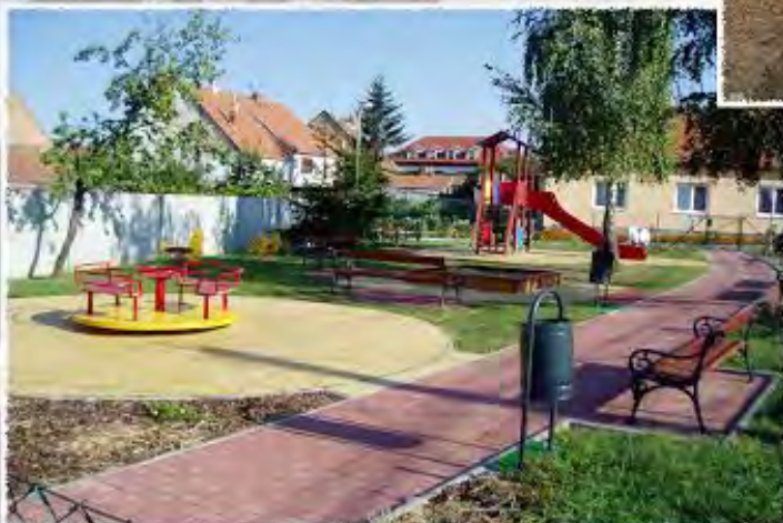
2009 - Dambořice - Dětské hřiště