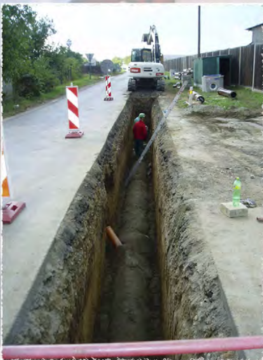
2008 - Rajhrad - Kanalizace a komunikace