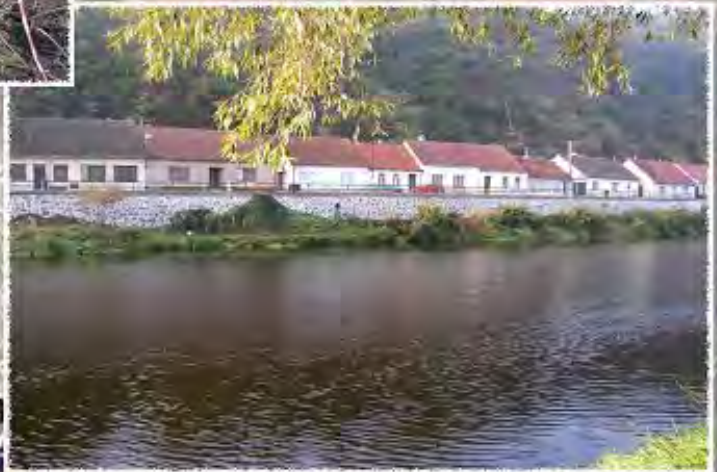
2010 - Dolní Kounice - Oprava opěrné zdi