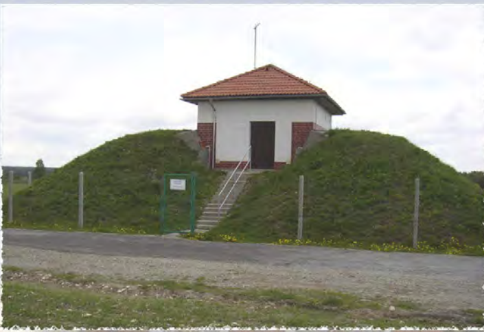
2001 - Stanoviště Vodojem, vodovod