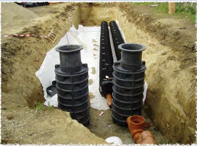
2008 - Němčičky Vsakovací galerie