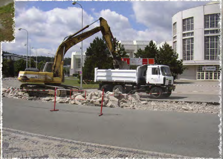
2007 - Veletrhy Brno Komunikace u pavilonu A