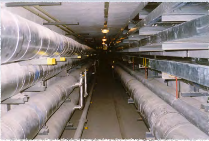
1994 - FN u sv. Anny - Kolektor