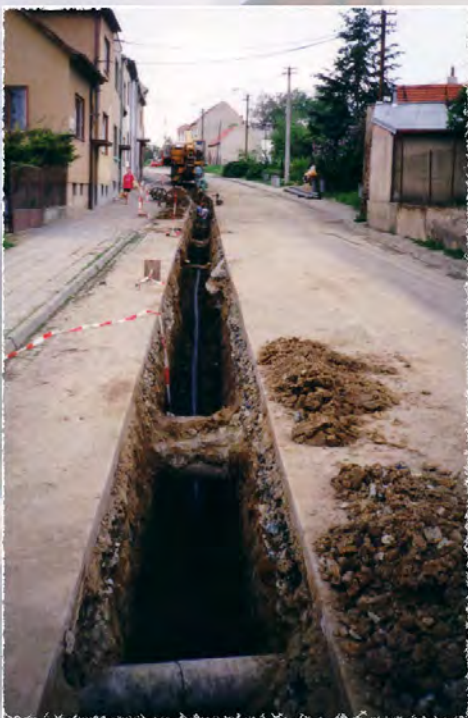
1993 - Bosonohy - Vodovod