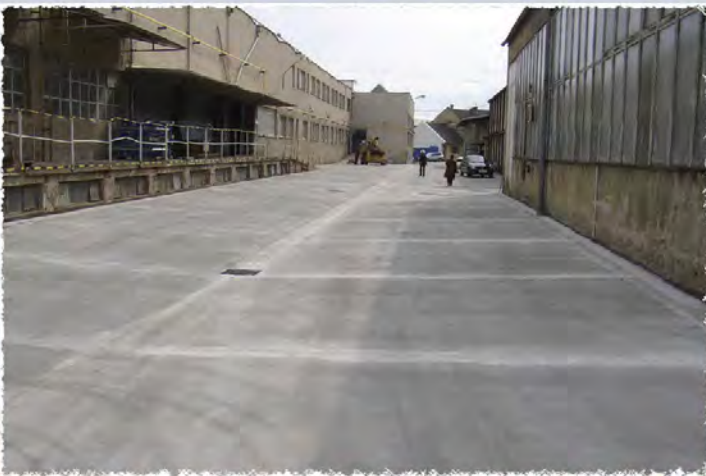
2005 - Brno Alstom Betonové komunikace