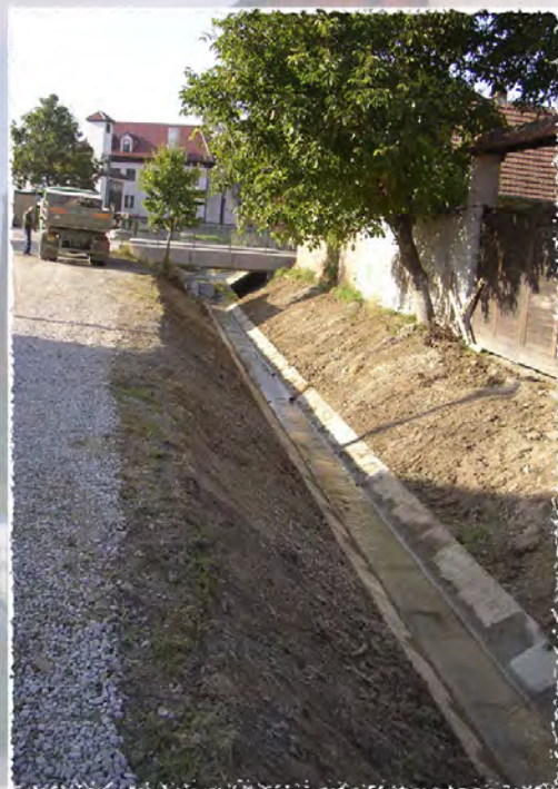
2005 - Dambořice - Úprava Salajky