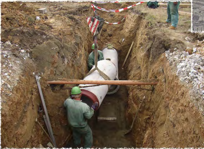
2007 - Slatina, ul. Tuřanka Kanalizace