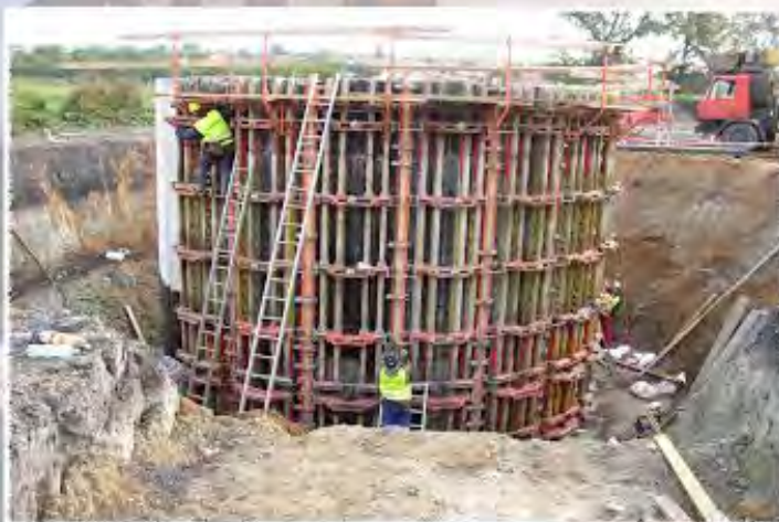
2010 - Starovičky - ČOV