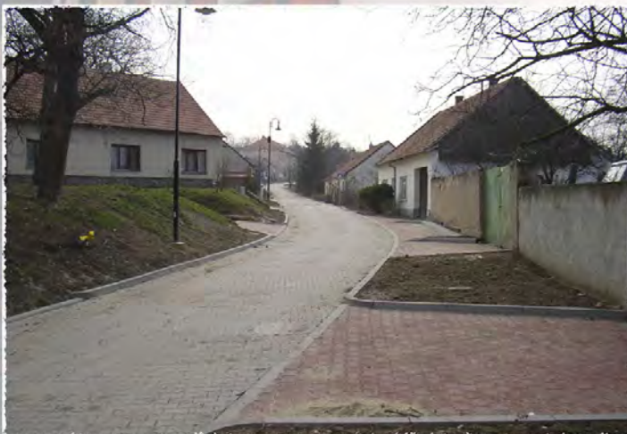
2006 - Heršpice - Komunikace