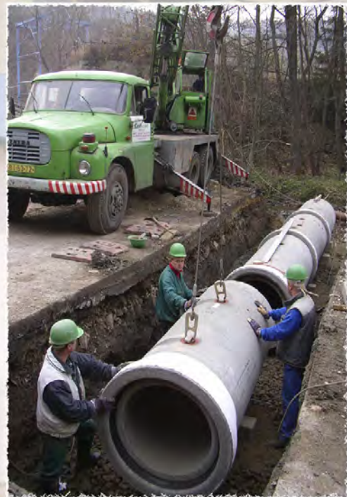
2006 - Rosice Propustek a komunikace